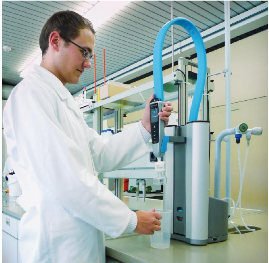
Abb. 1: Damit die Auszubildenden moderne Analyseverfahren erlernen und im Labor anwenden können, muss die zuverlässige Versorgung mit ultrareinem Wasser gewährleistet sein. Das Berufskolleg Olsberg nutzt dafür ein Purelab flex Reinstwassersystem von Elga. Die Anlage ist einfach zu bedienen und dank des flexiblen Haltearms können Behälter unterschiedlichster Formen und Größen bequem befüllt werden.

In der Herstellung von Puffern und Proben im Labor spielt Reinstwasser eine Schlüsselrolle. Analyseverfahren wie AAS, HPLC und VAMM können in einer Lösung Elemente in sehr geringen Mengen im ppb- oder ppt-Bereich nachweisen. Deshalb darf das Wasser, das als Lösemittel verwendet wird, keine Verunreinigungen in den zu analysierenden Proben verursachen und da-